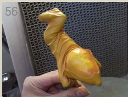
56 何度も確認しながら服色を丁寧に吹いていきます。