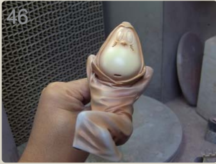
46 顔と服も同様に吹いていきます。