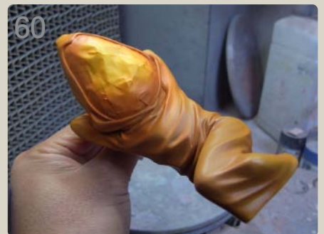
60 何度も確認しながら服色を丁寧に吹いていきます。