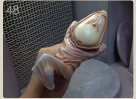
48 何度も確認しながら影グラデーションを吹きます。