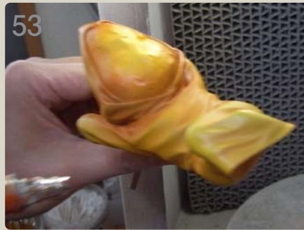
53 服色を丁寧に吹いていきます。